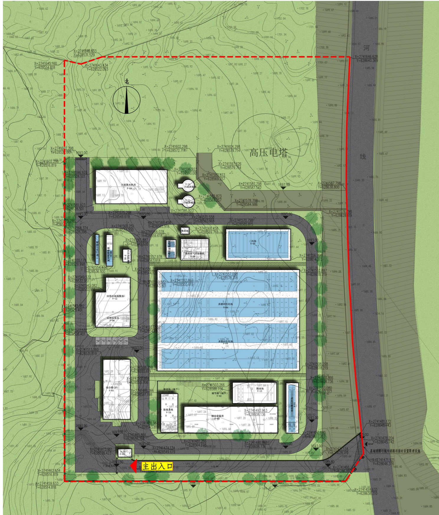
石林第三污水处理厂建设项目规划用地总平面效果图