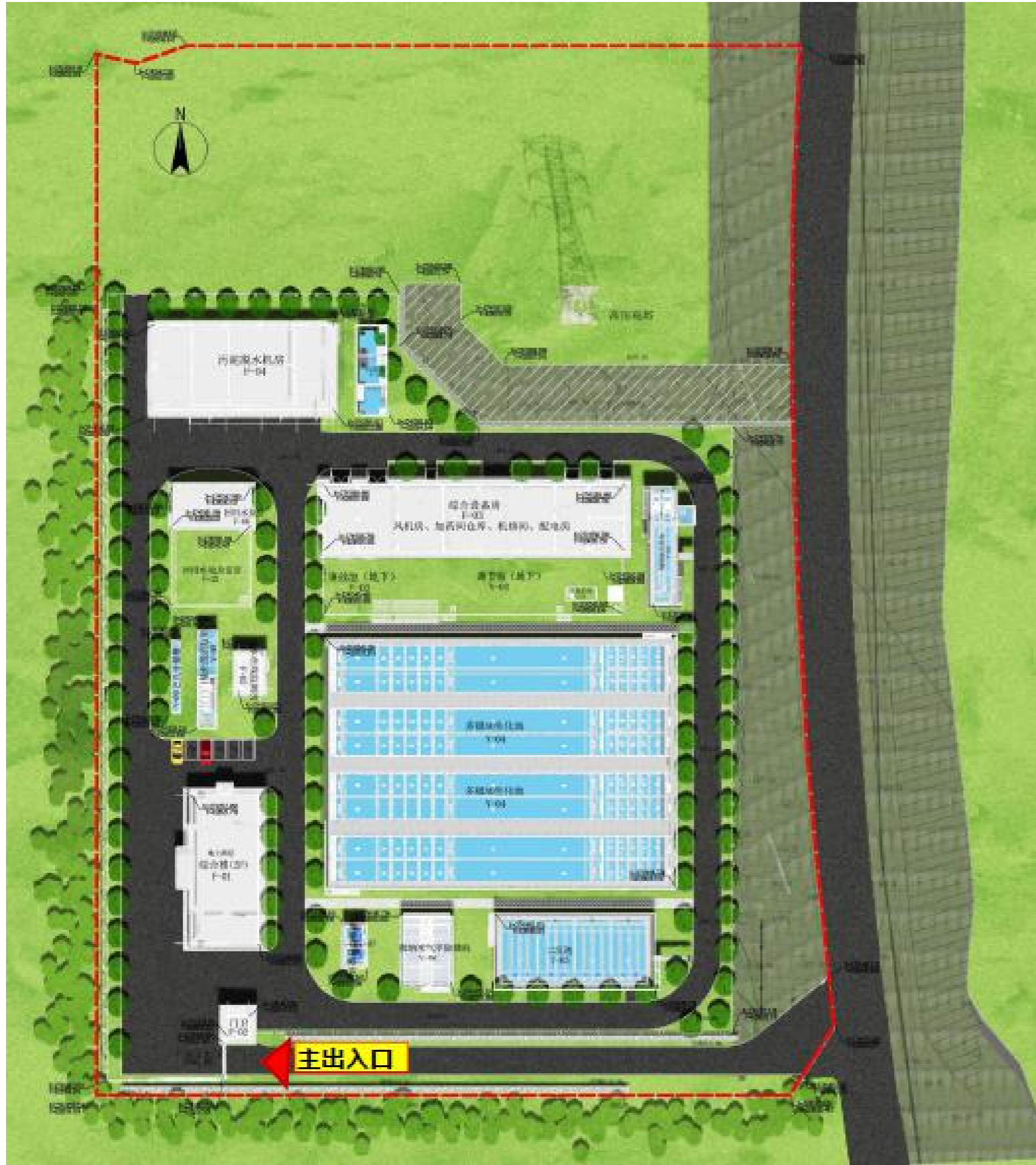
石林第三污水处理厂建设项目规划用地总平面效果图